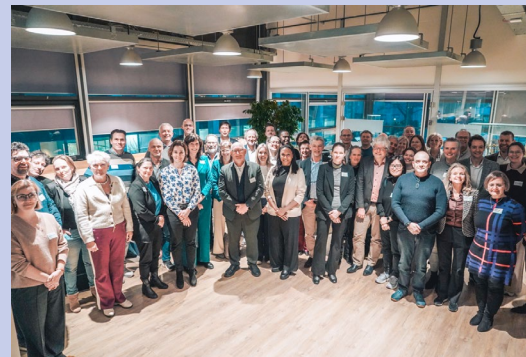
Groepsfoto deelnemers NAE-Forum 10 februari 2026

Tijdens het NAE-Forum op 10 februari 2026 bij cosine in Sassenheim bediscussieerden 60 NAE-leden en partners vanuit verschillende engineering disciplines de noodzaak om silo's in het technisch onderwijs te doorbreken ten gunste van het vergroten van instroom in en verkleining van uitstroom van engineering talent uit het technisch onderwijs. Dit leidde tot een gedragen visie over hoe de lekkende engineering talent pijplijn gerepareerd kan worden.